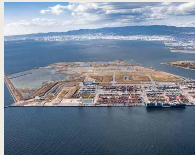
カジノ予定地の夢洲(大阪市此花区)